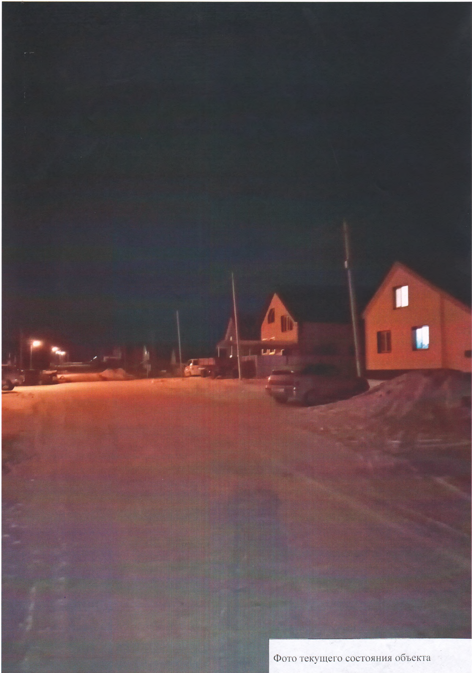
Фото текущего состояния объекта