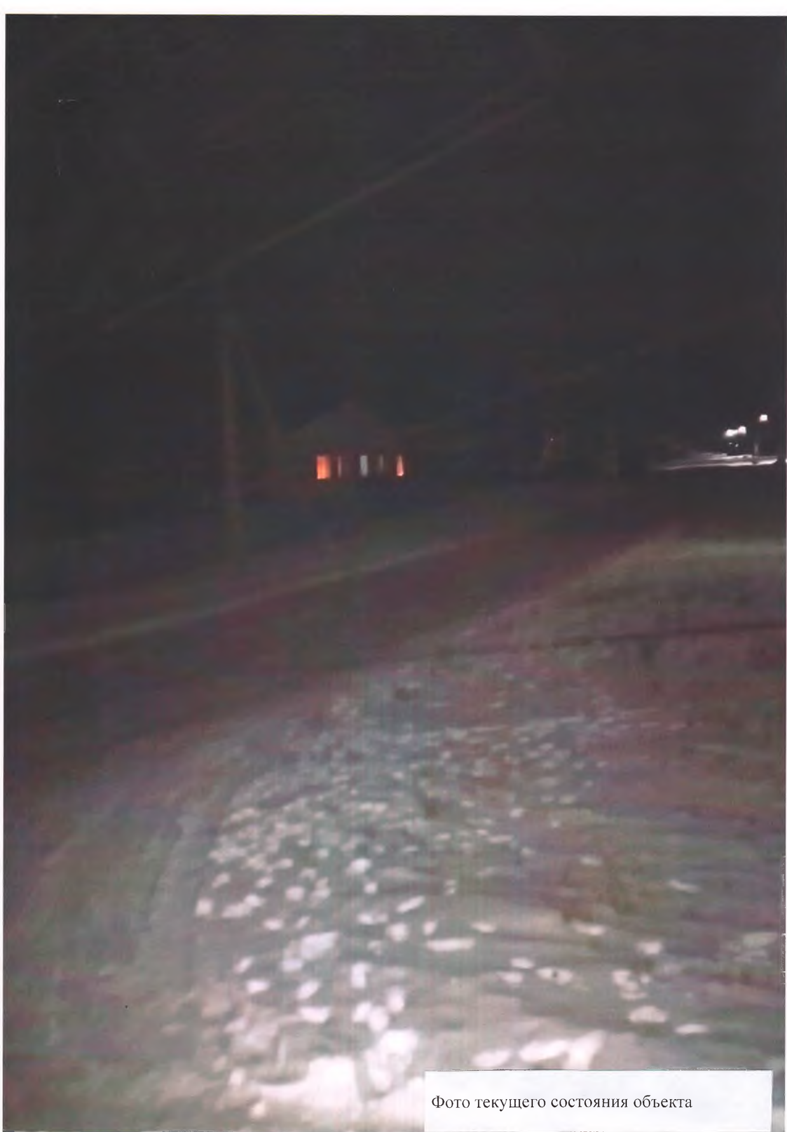
Фото текущего состояния объекта