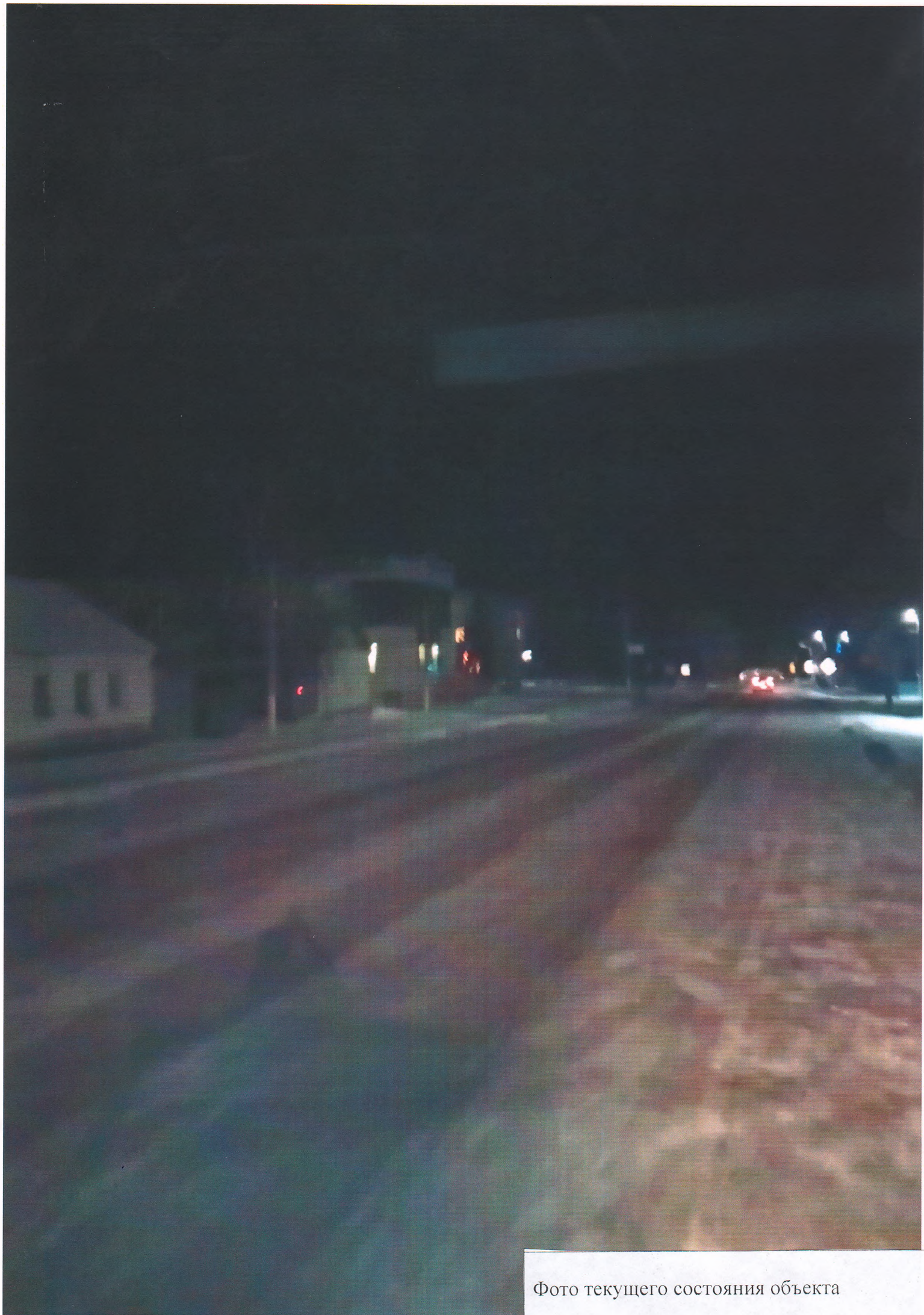
Фото текущего состояния объекта