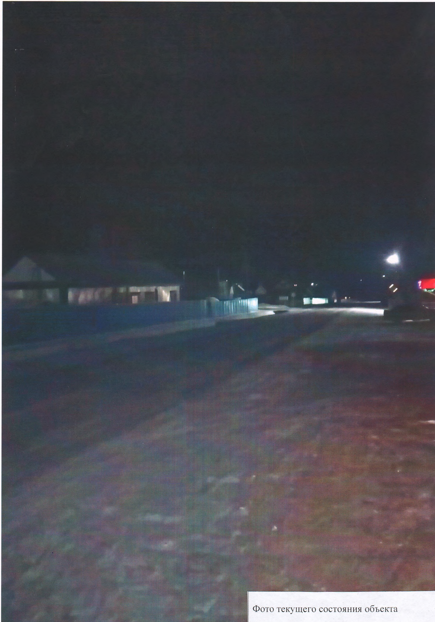
Фото текущего состояния объекта