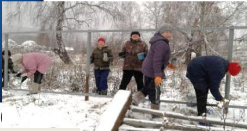
Учалинский район, д. Каримово

Каждый проект помимо денежного участия включает в себя неоплачиваемый вклад со стороны населения и спонсоров