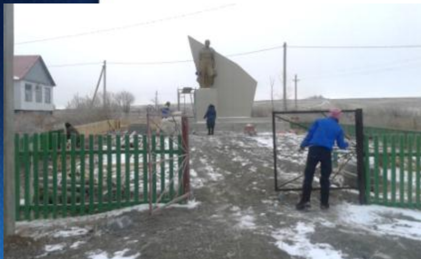
Хайбуллинский район, с. Федоровка

Каждый проект помимо денежного участия включает в себя неоплачиваемый вклад со стороны населения и спонсоров